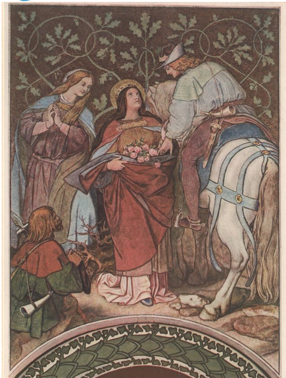
Das Rosenwunder der Heiligen Elisabeth