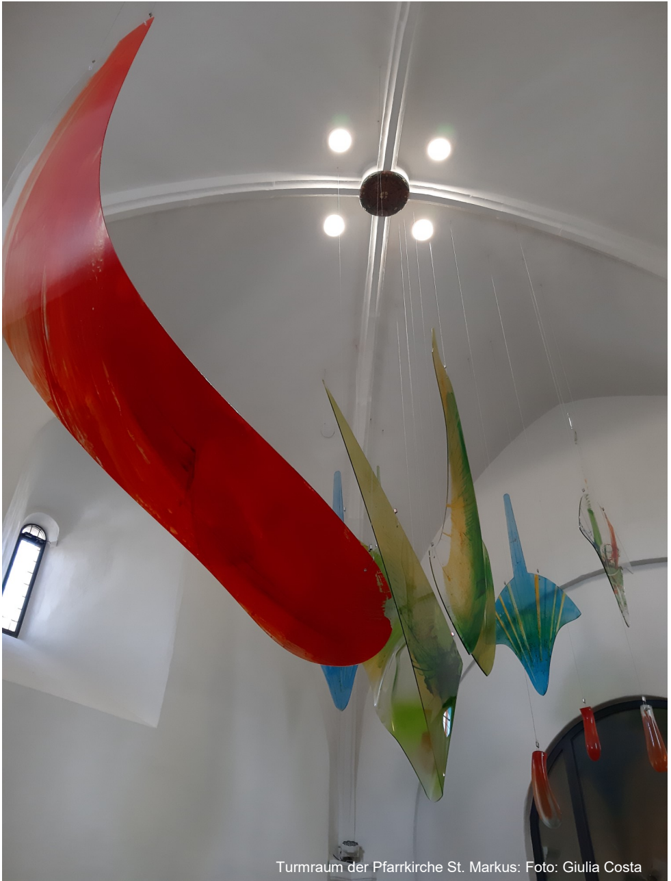
Turmraum der Pfarrkirche St. Markus