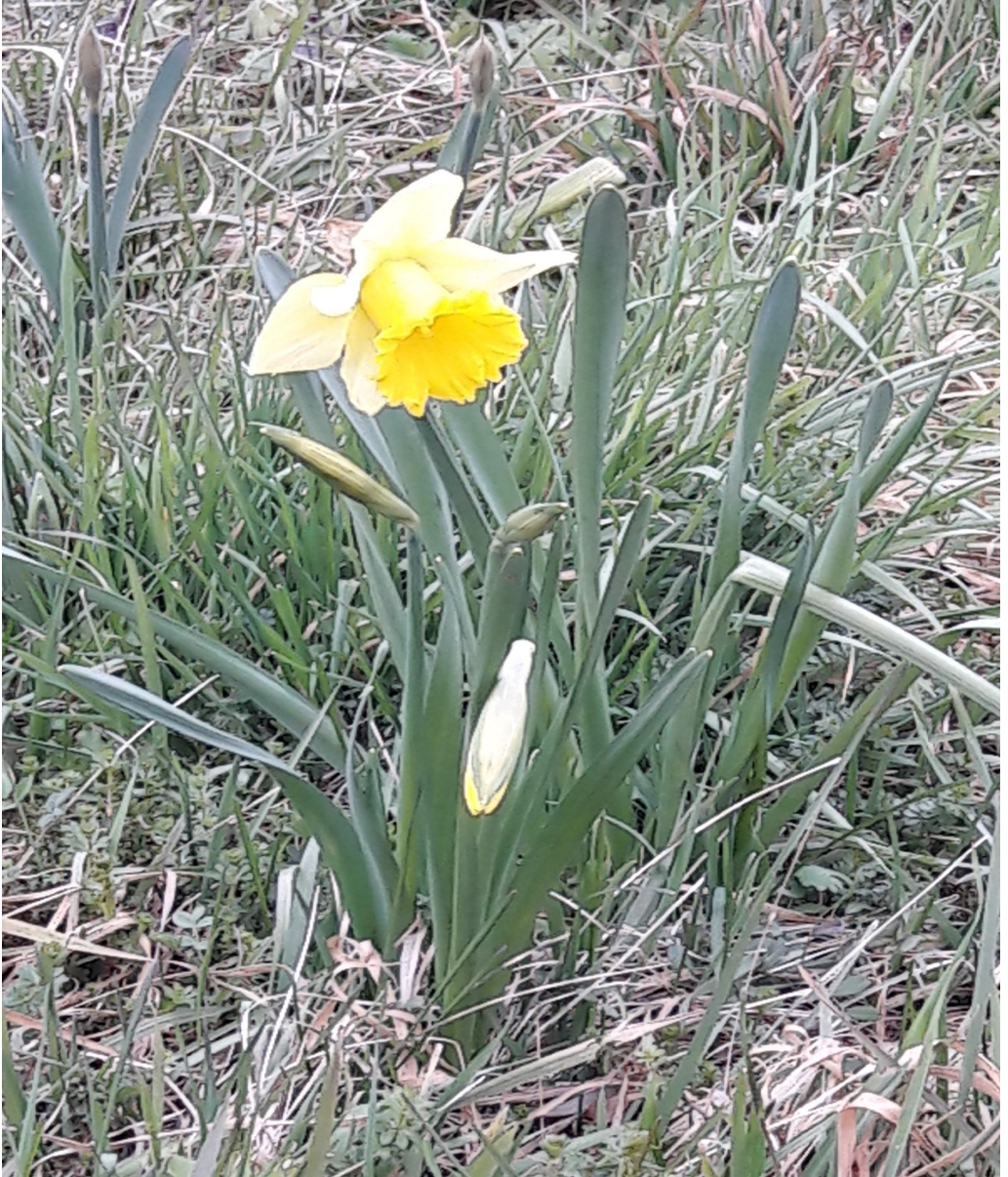
Osterglocke am Mesenberg in Wittlich